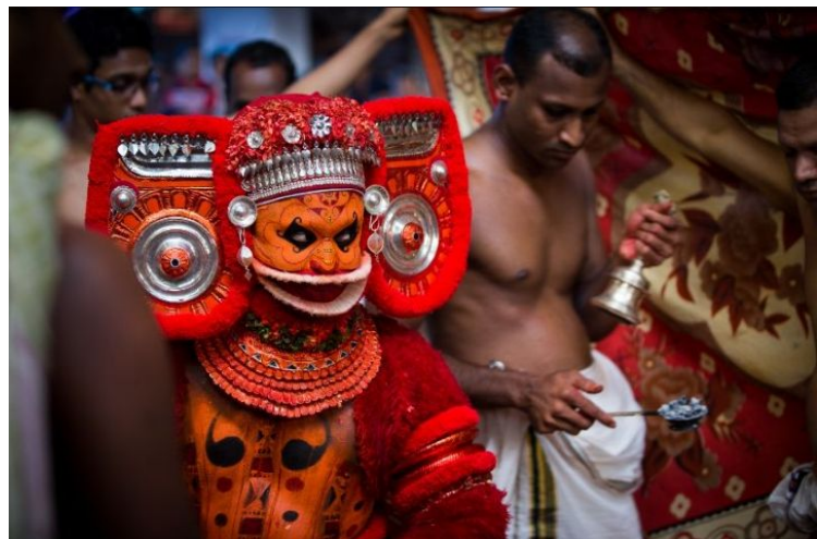
മേലേരി തട്ടുന്നതിനു മുമ്പുള്ള പൂജ