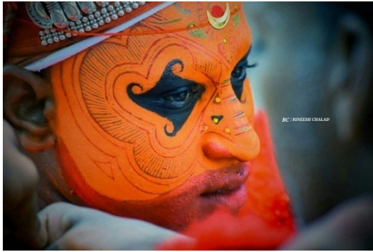
തെയ്യം ഹനുമാൻ കണ്ണിട്ട എഴുത്ത്