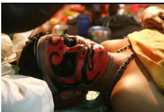
ബാലി മുഖത്തെഴുത്ത്, ചുട്ടി കുത്തൽ