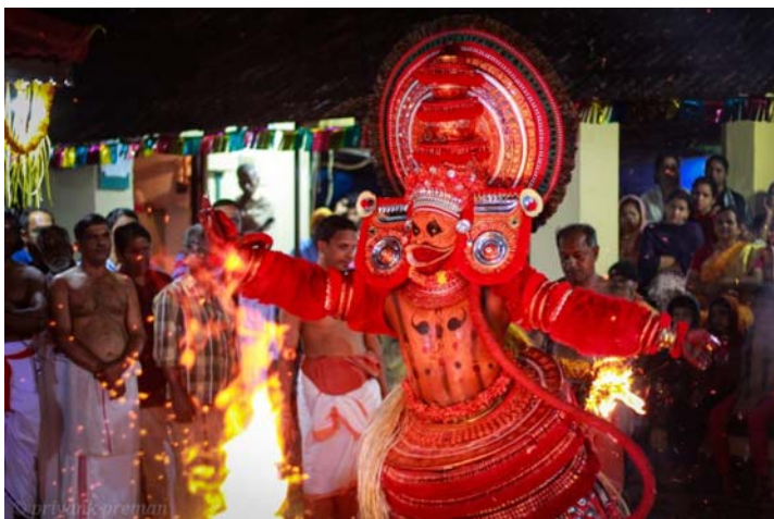
സുഗ്രീവനെ തേടിക്കൊണ്ട് ക്ഷേത്രപ്രവേശനം