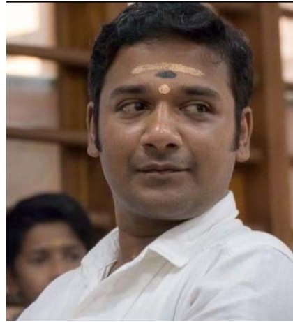
കലാമണ്ഡലം സംഗീത് ചാക്യാർ കുടിയാട്ട വിഭാഗം അദ്ധ്യാപകൻ,കലാമണ്ഡലം