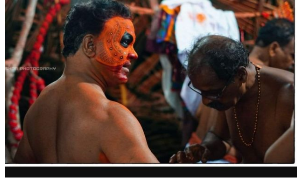
തെയ്യം കുറ്റിശംഖ് എഴുത്ത്