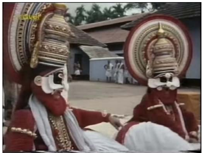
പുലിയങ്കം (പഴയകാല ചിത്രം)