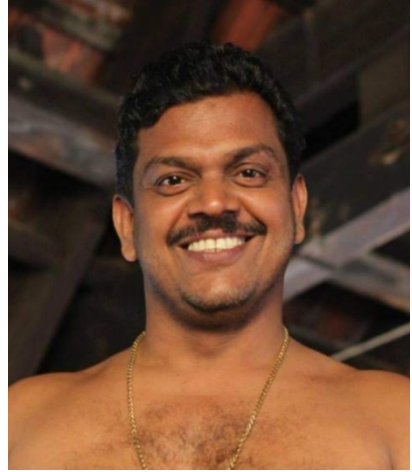
കലാമണ്ഡലം നാരായണ നമ്പ്യാർ അമ്മന്നൂർ ചാച്ചുച്ചാക്യാർ സ്മാരക ഗുരുകുലം