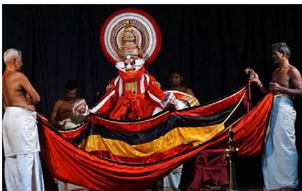
ബാലിവിജയം ബാലിയുടെ തിരനോക്ക്