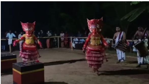
മണ്ഡപം കാവിലെ ബാലിസുഗ്രീവനാ- രുടെ വെള്ളാട്ടം