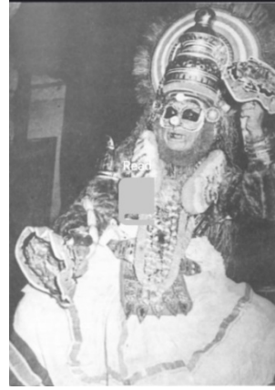
പരമഭൂഷൺ അമ്മന്നൂർ മാധവച്ചാക്യാർ