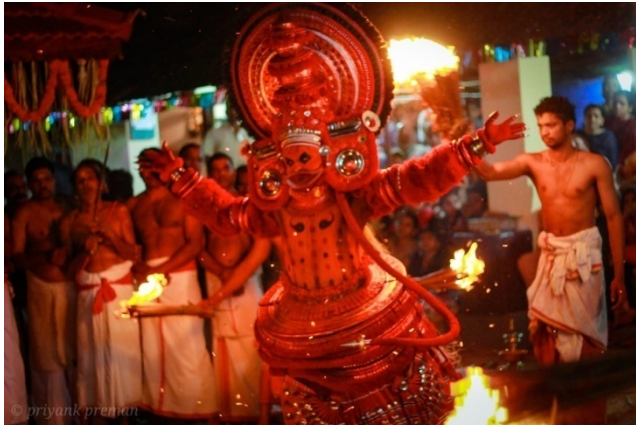
കലാശം കഴിഞ്ഞ് നാല് ഭാഗത്തും ഓടുന്നു