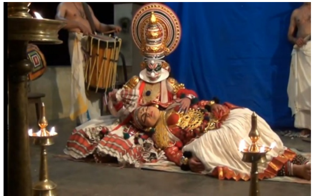
ബാലിവിജയം (അരവിന്ദജോപനയനേ രംഗം)