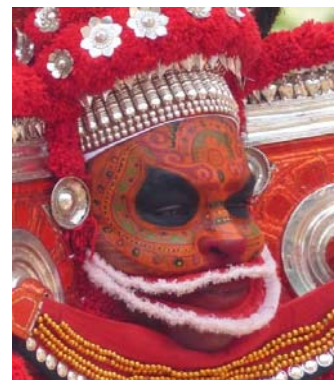
ബാലി തെക്കൻ സമ്പ്രദായം