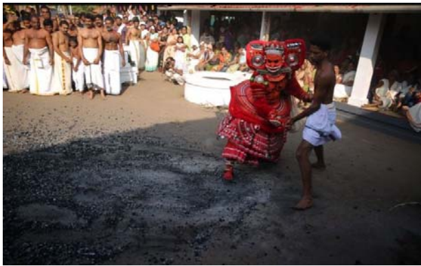
മേലേരി തട്ടൽ അവസാനം