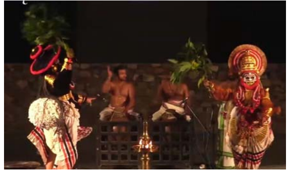
കൊമ്പുകൾ കൊണ്ടുള്ള യുദ്ധം