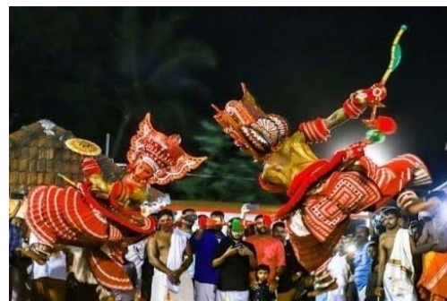
വലിയവീട് ക്ഷേത്രത്തിലെ ബാലി- സുഗ്രീവയുദ്ധം വെള്ളാട്ടം