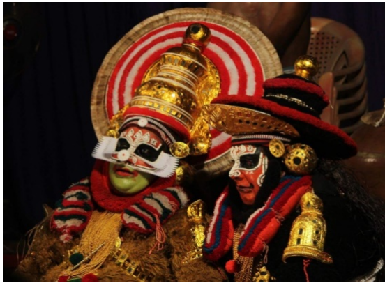
ബാലി ശരം തറച്ച ശേഷം