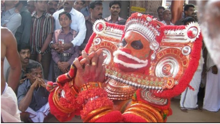
പുജ തൊഴുത് ഇരിക്കുന്നു.