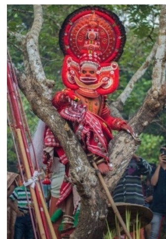
മരത്തിന്റെ മുകളിൽ കയറി തേടുന്നു