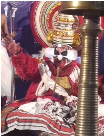
ശരം തറച്ച് വീണശേഷം