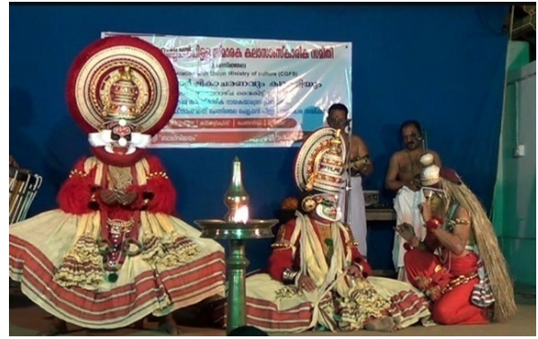
ബാലിയുടെ വാലിൽ ബന്ധിക്കപ്പെട്ട രാവണൻ