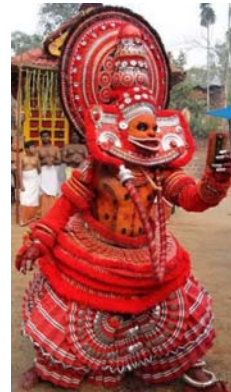
അണിവുകൾ മുഴുമിച്ച് മുഖദർശനം