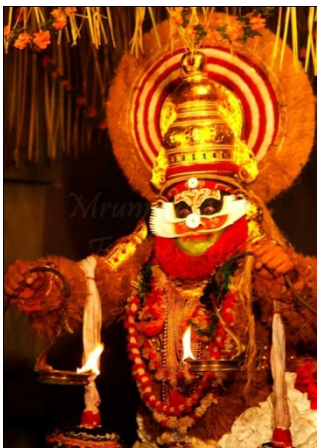
വിളക്കു പിടിച്ച് പെരുമാറ്റം