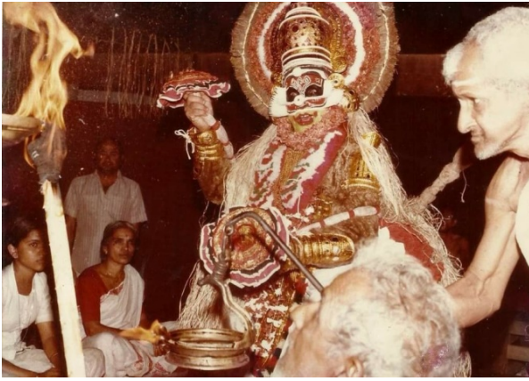
ബാലിയുടെ പ്രവേശം (മുൻകാല അണിവുകൾ)