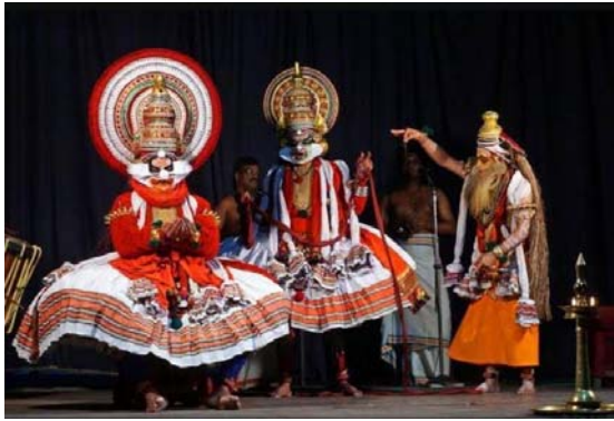
ബാലി തർപ്പണം ചെയ്തിരിക്കുന്നു. രാവണൻ കെട്ടാൻ ബാലിയെ ശ്രമിക്കുന്നു.