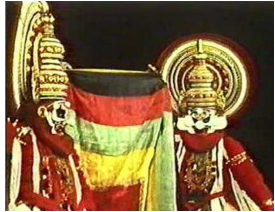
പർവ്വതം ചുറ്റൽ (മുൻകാലങ്ങളിൽ)