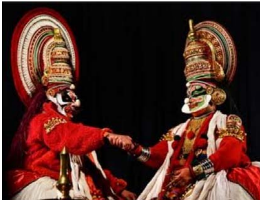
ബാലിയും രാവണനും സഖ്യം ചെയ്യുന്നു