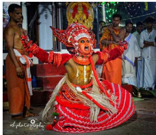
ശരം തറയ്ക്കുന്ന സമയം