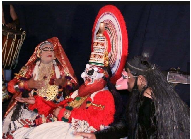
അംഗദനോടും താരയോടും കൂടെ