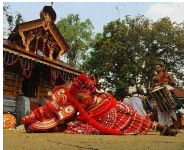
സോപാനം പടിയ്ക്കൽ കലാശം