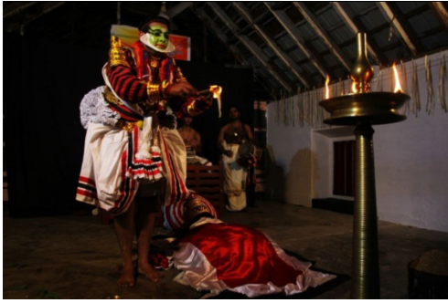
അങ്കാവസാനം നടത്തുന്ന മുടിയക്കിത്ത