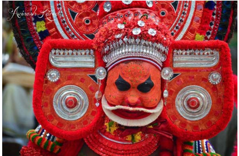
ബാലിത്തെയ്യം കല്ലിങ്ങാടൻ സമ്പ്രദായം