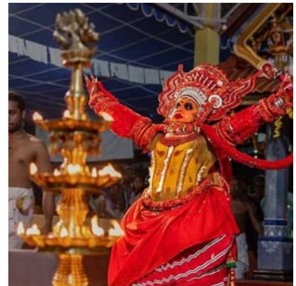
കലാശം (പർവ്വതം ചാടൽ)