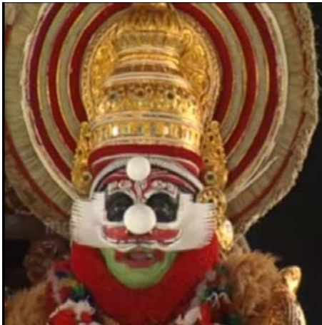
മരണരംഗം- പത്മശ്രീ. കലാമണ്ഡലം ശിവൻ നമ്പൂതിരി