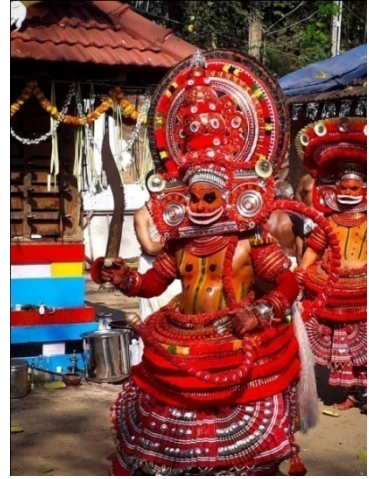
മറ്റ് തെയ്യങ്ങളോടുകൂടി കലാശം