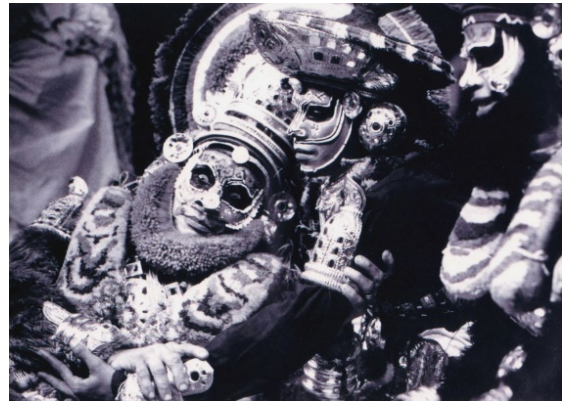
ബാലിയും സുഗ്രീവനും അംഗദനും