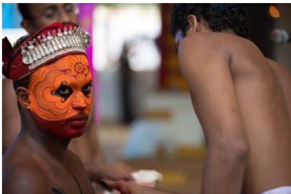
മെയ്യെഴുത്ത് വടക്കൻ സമ്പ്രദായം